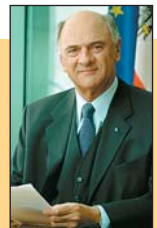
LH Dr. Erwin Pröll, Initiator von „NÖ gestalten“

Mit „NÖ gestalten“ haben wir eine Plattform für all jene geschaffen, die in Niederösterreich bauen und gestalten. Nutzen auch Sie unser Informations- und Weiterbildungs-Angebot!