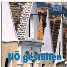
Titelbild: Kellergasse Falkenstein