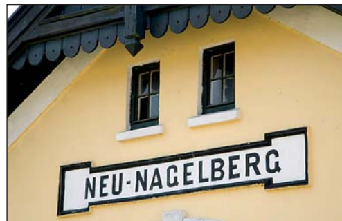
Scheinbar unscheinbar: Zu Gast sind wir diesmal in Neunagelberg bei Gmünd. Seite 18.