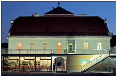
In Pillichsdorf wurde das Gemeindehaus erweitert, um Platz für Veranstaltungen zu schaffen. Seite 14.